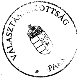
Bedecs Ferenc az OEVB elnöke